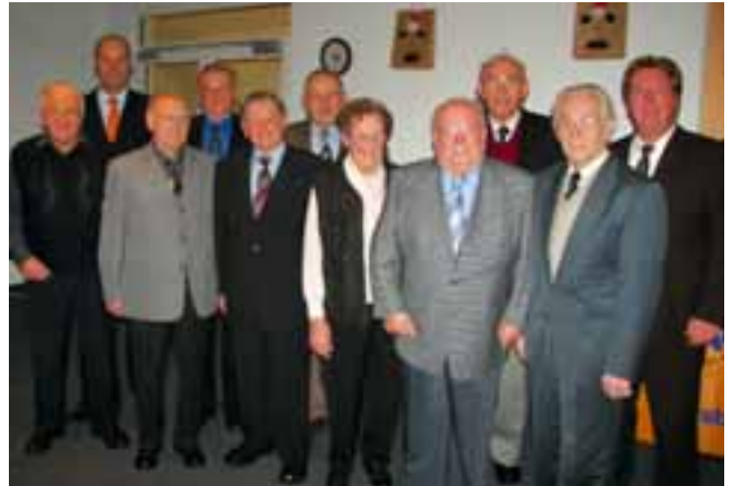
Seit 50 Jahren Bankteilhaber unserer Volksbank

Einige Mitglieder aus Altenberge und Nordwalde nutzten die Gelegenheit, vor der Rückfahrt noch die Grevener Hauptstelle zu besichtigen.