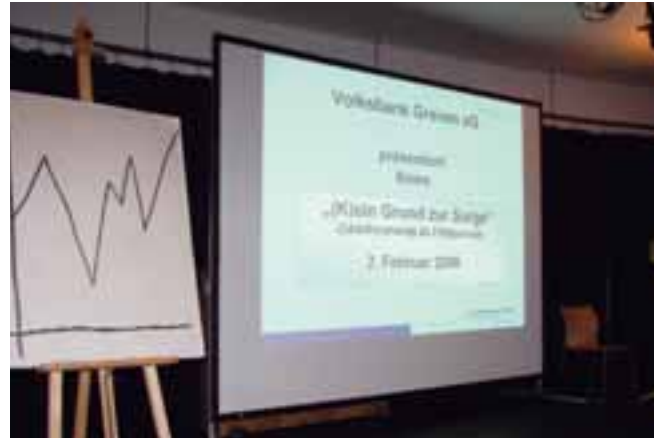
Mitarbeiterveranstaltung in der Kulturschmiede Greven

Die Zahl der abgeschlossenen Riester-Renten verdreifachte sich im Vergleich zum Jahr 2005.