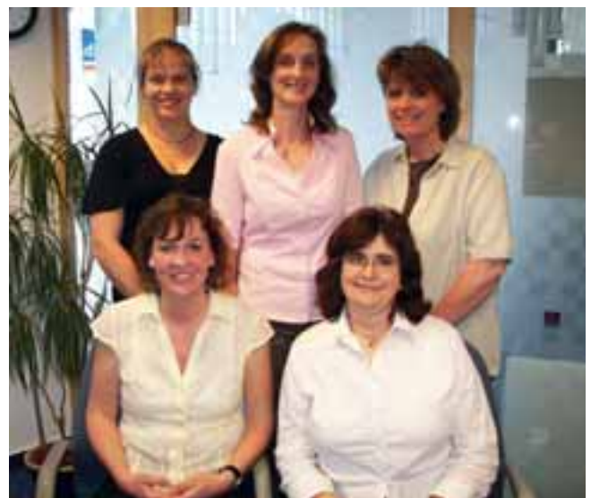
Das Team des KundenServiceCenters

Die Mitarbeiterinnen des KSC halten darüber hinaus viele aktuelle Informationen und Antworten auf Fragen unserer Kunden bereit.