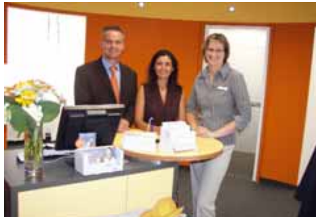
der Geschäftsstelle Süd an der Schützenstraße und