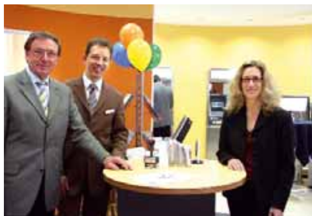
der Geschäftsstelle West an der Emsdettener Straße am Eröffnungstag.