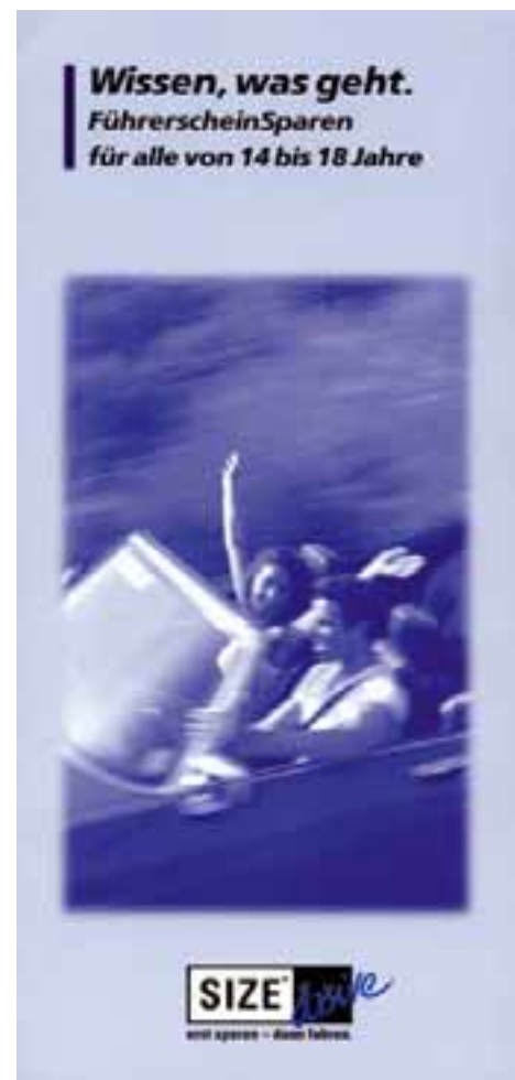
Führerscheinsparen: "erst sparen – dann fahren"