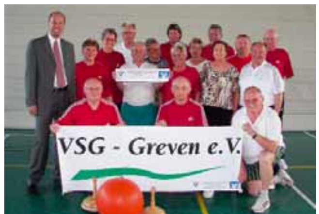
Auch die Versehrten-Sportgemeinschaft Greven freute sich über eine Spende.