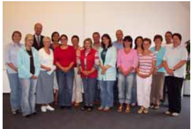
Spendenübergabe an die Kindergärten- und tageseinrichtungen