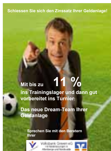
Die Fußball-WM stand Pate bei dieser Geldanlage