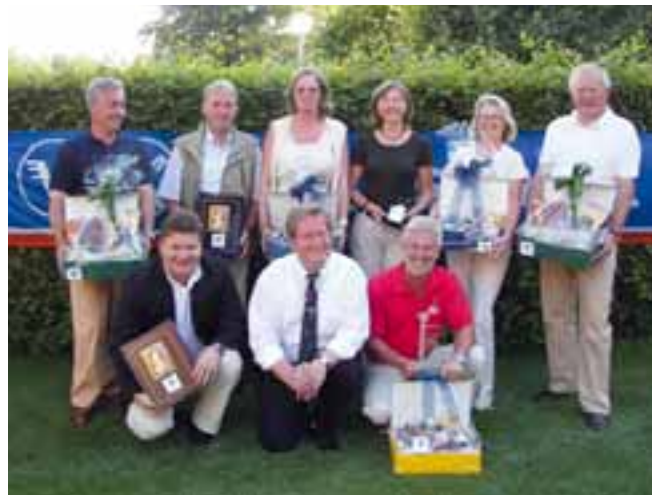
Die Sieger des Volksbank Greven Cup's