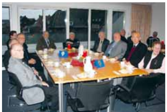
Gemütliches Kaffeetrinken nach der Ehrung